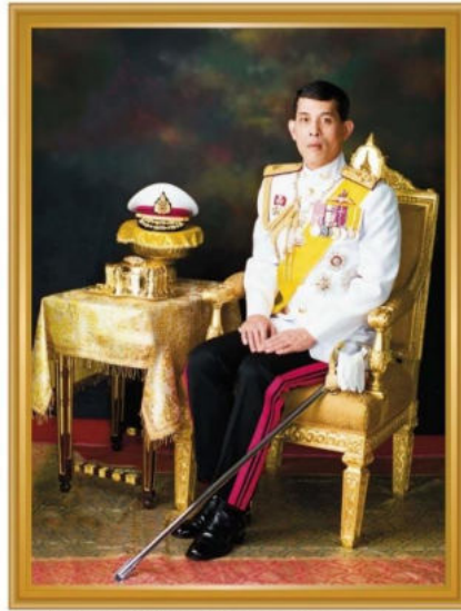
สมเด็จพระเจ้าอยู่หัวมหาวชิราลงกรณ บดินทรเทพยวรางกูร